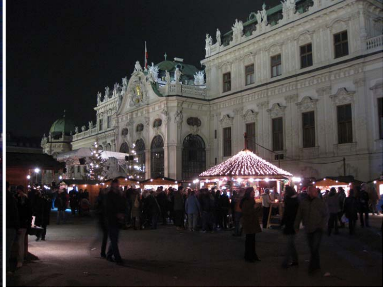
Vánoční trh před zámek Oberes Belvedere