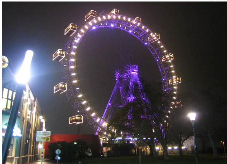
Obří vídeňské kolo v Prátru, kolem kterého půjdeš