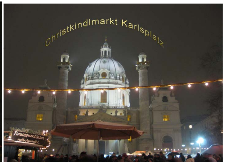
Vánoční trh na náměstí Karlsplatz