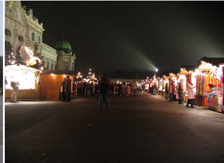
Prostranství před zámek Oberes Belvedere