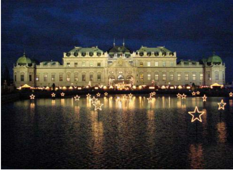
Zámek Belvedere s vodní nádrží