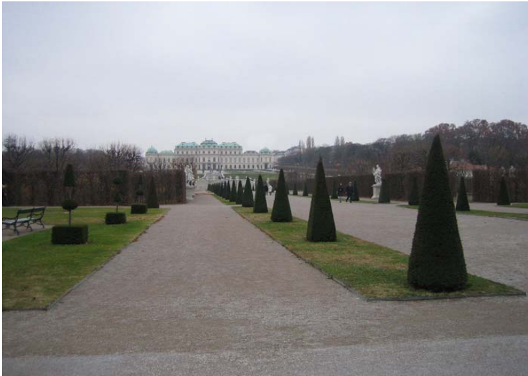
Park Unterer Belvedere, v pozadí Oberes Belvedere